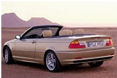
بی ام و

به خودروهایی با قابلیت جمع شونده یا برداشت سقف گفته می شود که در آنها سقف ثابت نظیر خودروهای کوپه وجود ندارد و سقف در بخشی از عقب خودرو جمع می شود. در این دسته از خودروها عموماً جنس سقف از مواد نرمی نظیر واینال یا برزنت بوده و شیشه عقب از جنس نایلون شفاف می باشد و در قسمت پشت صندلی عقب بصورت بالشت مانند و یا در صندوق بار جمع می شود که با این روش حجم کمی از صندوق بار را اشغال می نماید. در برخی از مدلها، سقف فلزی و ۲ تکه بوده و به جای نایلون قسمت عقب از شیشه استفاده شده که این نوع سقف پس از تاشدن بصورت دستی یا الکتریکی در صندوق بار جای گرفته که البته حجم زیادی از صندوق بار را اشغال می نماید. در برخی از مدلها نیز سقف فلزی و یک تکه بوده که پس از باز کردن، باید آنرا از روی خودرو جدا کرده و در محلی دیگر نگهداری نمود .