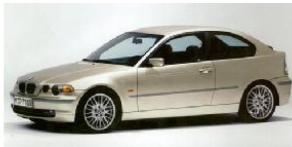
بی ام و