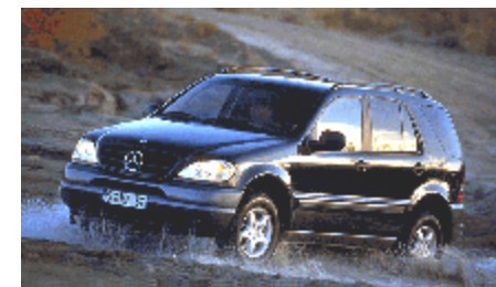
مرسدس بنز M Class