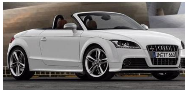
آئودی تی تی