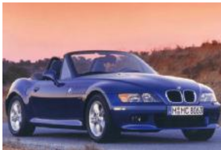
بی ام و

شامل اتومبیل‌های روباز اسپرت ۲ نفره بوده و خودروهای این گروه نسبت به سایر خودروهای اسپرت از نظر ابعادی کوچکتر می باشند. در بخش عقب خودرو نیز محل نسبتاً کوچکی برای بار وجود دارد. سقف این دسته از خودروها عموماً از جنس مواد نرم نظیر برزنت و یا واینال بوده و قابلیت جمع شوندگی داشته و شیشه عقب از جنس نایلون شفاف می باشد. در برخی مدلها نیز سقف فلزی وجود دارد که قابلیت برداشته شدن دارد. در اغلب این خودروها در پشت صندلیها میله محافظی وجود دارد که در هنگام واژگونی از سرنشینان محافظت می نماید و در برخی نیز این امکان وجود دارد که شیشه جلو بر روی کاپوت خوابیده شود.