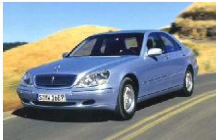
مرسدس بنز S-class