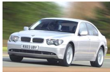
بی ام و سری ۷